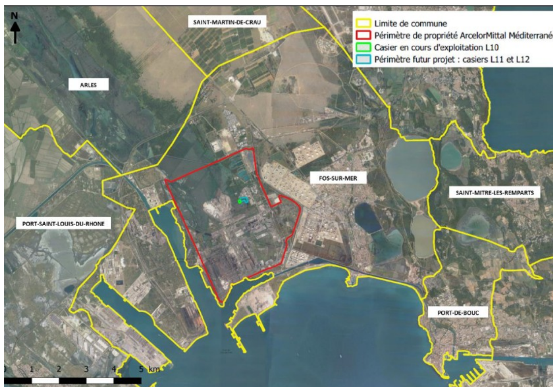
Figure 1 : localisation du site et du projet (source : note de présentation non technique)

Afin de répondre à l'objectif national de transition vers une économie circulaire, ArcelorMittal souhaite valoriser les déchets produits par le site en réutilisant les laitiers d'aciérie de conversion (3) issus du procédé de fabrication, comme matériaux alternatifs dans la création des futurs casiers.