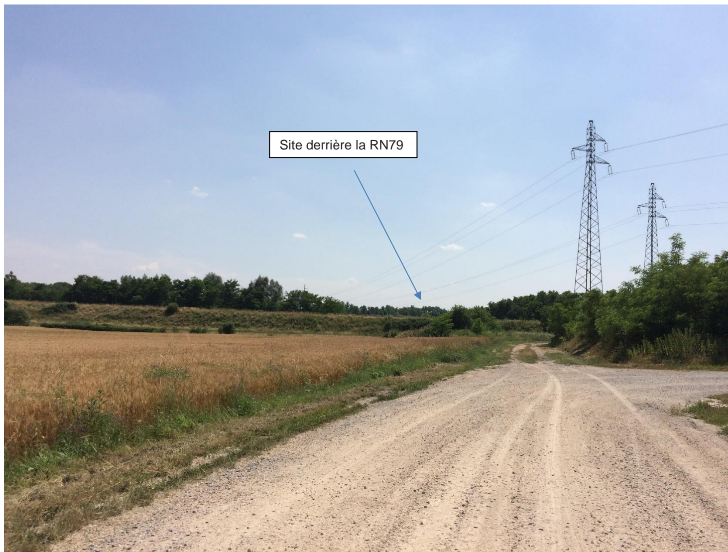
Vue PC6-3 photomontage vue lointaine depuis le nord du site (projet non visible)

Frédérique LONCHAMPT EURL d'ARCHITECTURE 2, Place Sainte Claire 38000 GRENOBLE Tel. 04 76 62 54 90 Fax 09 67 33 54 90