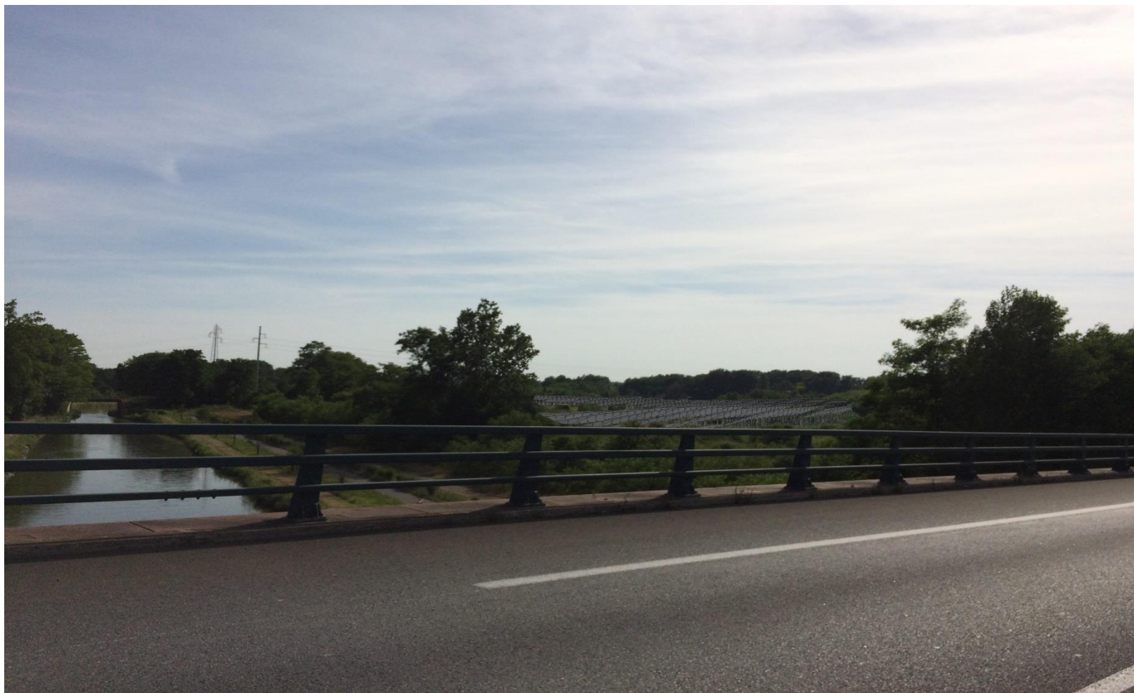
Vue PC6-2 photomontage vue proche depuis le nord du site

Frédérique LONCHAMPT EURL d'ARCHITECTURE 2, Place Saint-Clair 38000 GRENOBLE Tel. 04 76 62 54 90 Fax 09 67 83 54 90