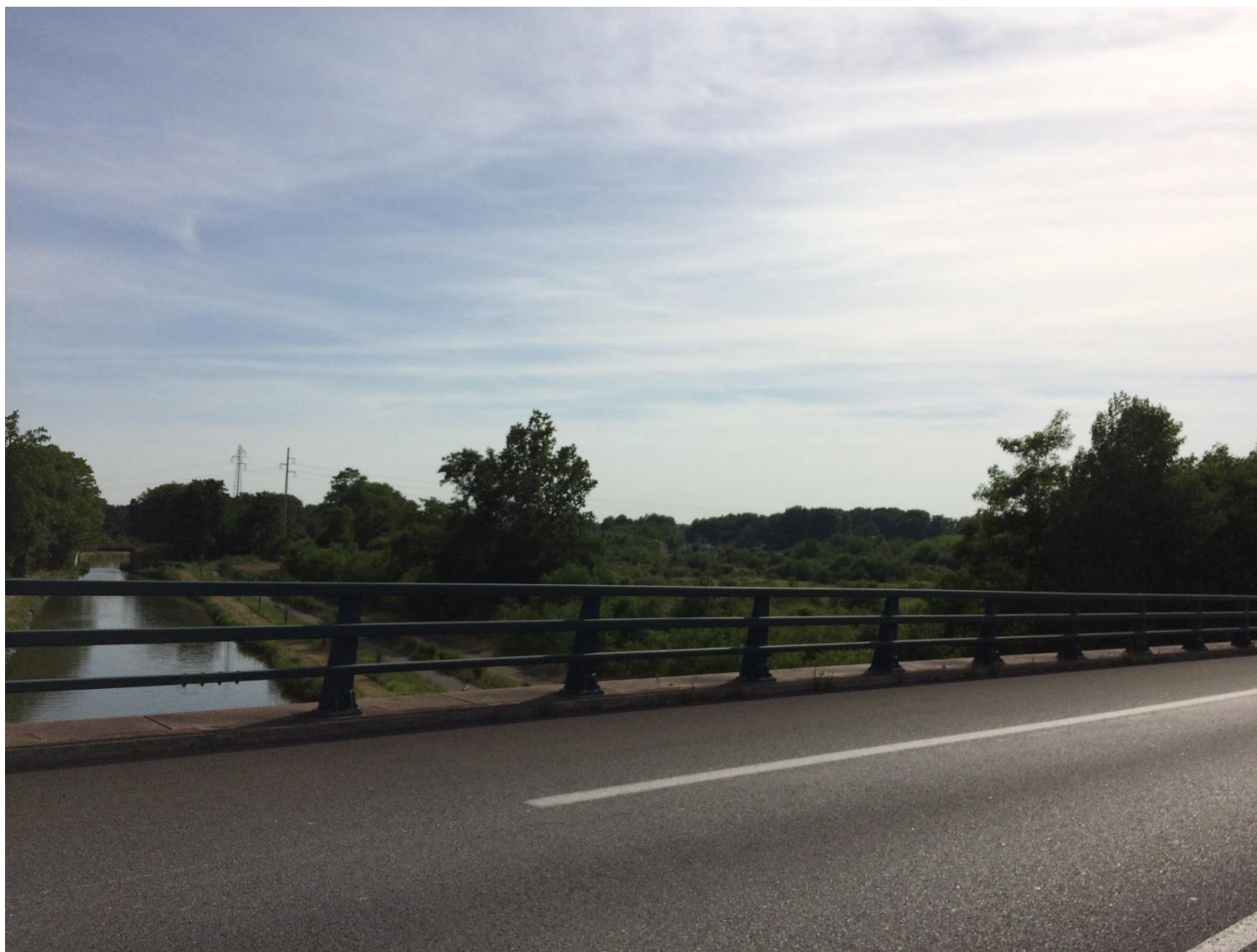
PC7-2 : Vue proche depuis le nord du site

Frédérique LONCHAMPT EURL d'ARCHITECTURE 2, Place Sainte Claire 38000 GRENOBLE Tél. 04 76 52 54 90 Fax 09 67 33 54 90