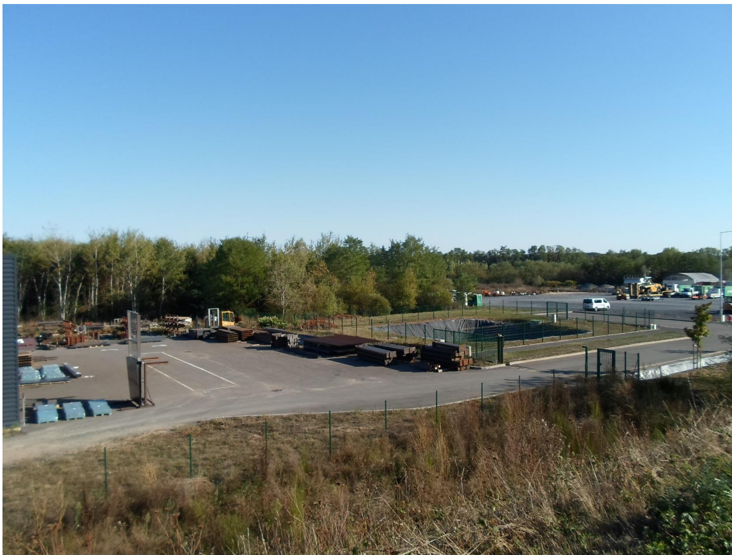
PC7-1 : Vue proche depuis l'Ouest du site

Frédérique LONCHAMPT EURL d'ARCHITECTURE 2, Place Sainte Claire 38000 GRENOBLE Tél. 04 76 62 54 90 Fax 09 67 33 54 90