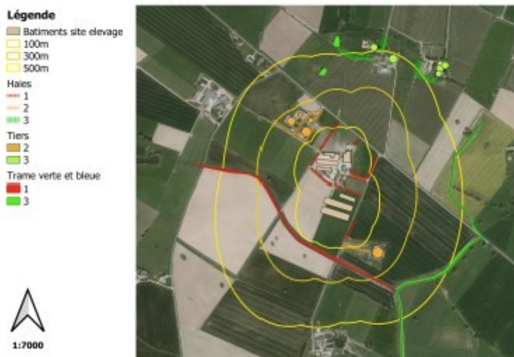
Plan de masse de l'exploitation